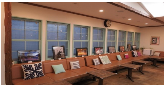
献血ルーム内展示の様子

*以後、8月、9月、10月、11月、2月、3月(除外12月、1月)にも展示します。ご予約ください。