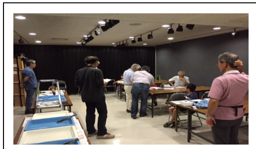
暗室で印画紙の現像～プリント

7月27日、28日に「町田市フォトサロン」で開催された教室には、前日26日の会場準備設営も含めMAPS会員のサポート協力ありがとうございました。教室は定員に満たなかったため、4回目を中止して早めに撤収しました。空いた時間を利用してサポートの皆様にご撮影体験をしていただくことができました。参加者の作品は8月14日(日)までフォトサロン1階に展示されていますので、ぜひご覧ください。